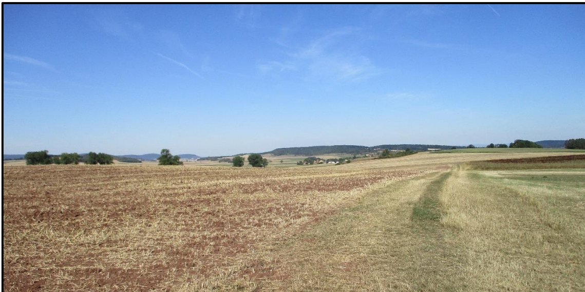
Abbildung 3: Blick vom Westen des Geltungsbereichs nach Alsleben

Flächen im Wohnumfeld von bis zu 1.000 m werden von Anwohnern bevorzugt für die Naherholung genutzt. Für die naturbezogene Erholung ist das Gebiet potenziell geeignet. Besonders hoch ist die Erholungsfunktion, wenn das Gebiet strukturreich und durch Freizeiteinrichtungen bereichert ist. Im Wirkbereich sind keine Freizeit- und Erholungseinrichtungen, Strukturen bzw. Landschaften mit hoher Erholungsnutzung vorhanden. Der Landschaftsausschnitt ist als ausgeräumte Agrarlandschaft zu bewerten. Durch das Gebiet verläuft ein örtlicher Wanderweg „Rundweg um St. Ursula“ sowie ein örtlicher Radweg und ein Fernradweg mit dem Namen „Rhön-Grabfeld-Radwanderweg“. Die drei Wege verlaufen entlang eines bebauten Weges zwischen den geplanten Anlagen.