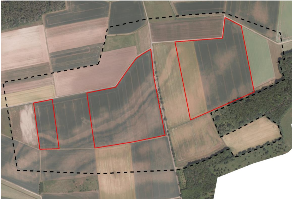
Abbildung 1: Untersuchungsgebiet (schwarz gestrichelt) und Geltungsbereich des Bebauungsplans Sondergebiet „Energiepark Alsleben-Ost“ (rote Umrandung)